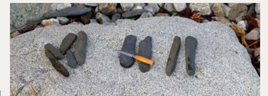
Naturlige bryner.

Den røde sandsteinen, «svensken», kommer helt fra Sverige. Den hvite granitten med svarte mineralkorn er en «bindaling».