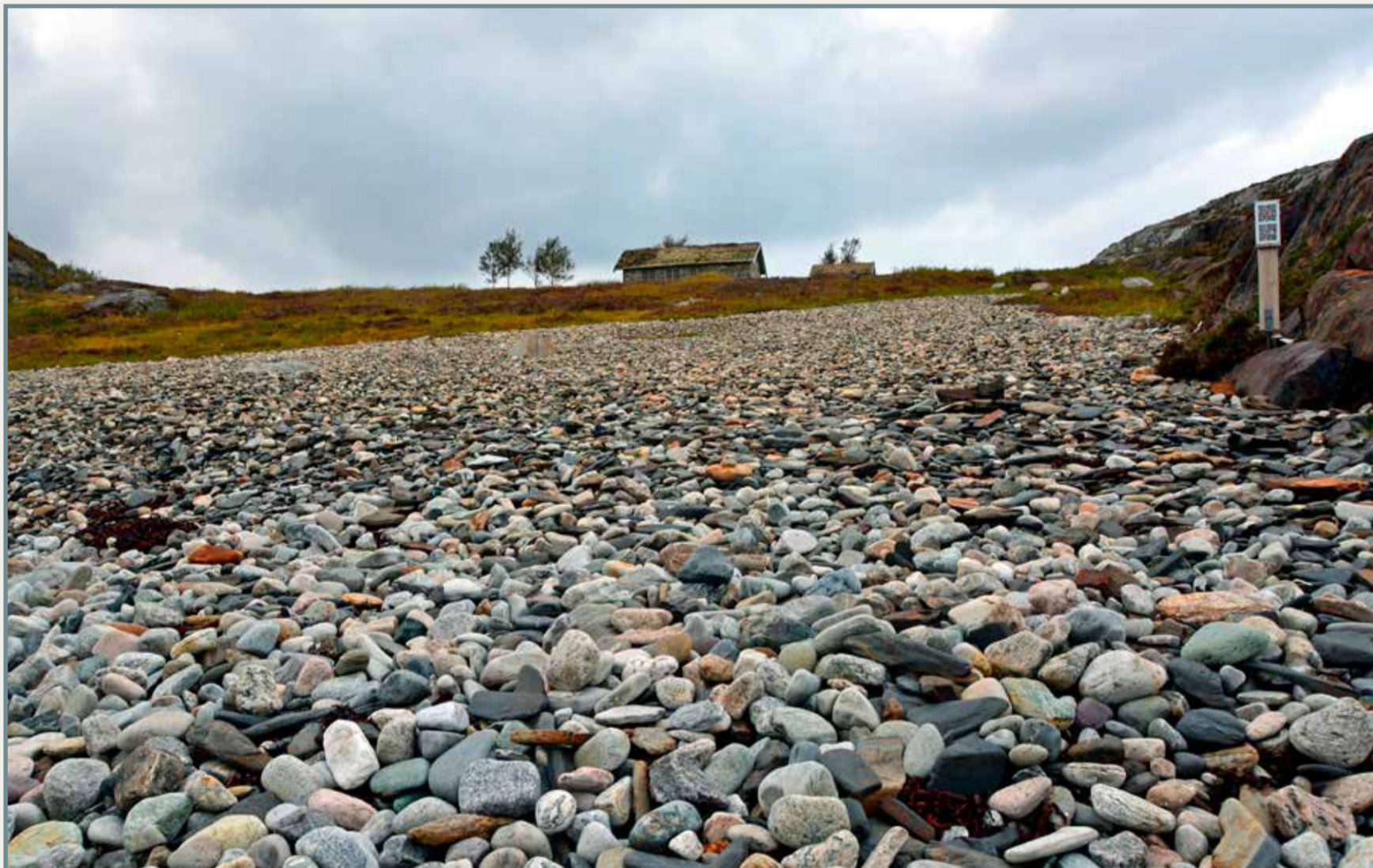
Rullesteinstranda i Vardvika med Steinhytta.

Hytta skal kunne brukes av alle. Det er ikke tillatt å overnatte i hytta. Vær snill å hjelpe oss med å holde hytta og området rundt ryddig og fint! Når du besøker hytta ber vi deg om å ta med søppel tilbake til søppeldunken ved parkeringsplassen.