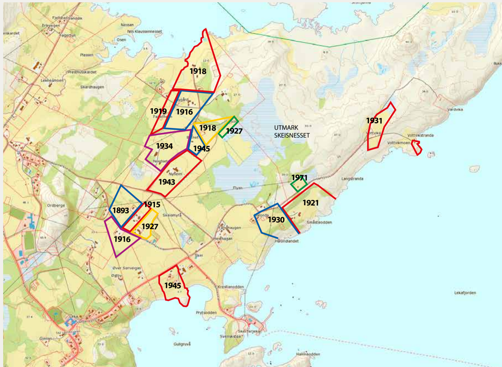
På Skei ble husmannsvesenet avvirket uvanlig sent. Kartet viser når husmannsplassene ble frikjøpt fra hovedbrukene på Skei. Noen av husmannsplassene ble ikke frikjøpt, og ble til slutt tatt tilbake i hovedbrukene. Sporene etter disse blir med tiden borte. Kartgrunnlag: Norge Digitalt. Grafisk utforming: Trond Haugskott.