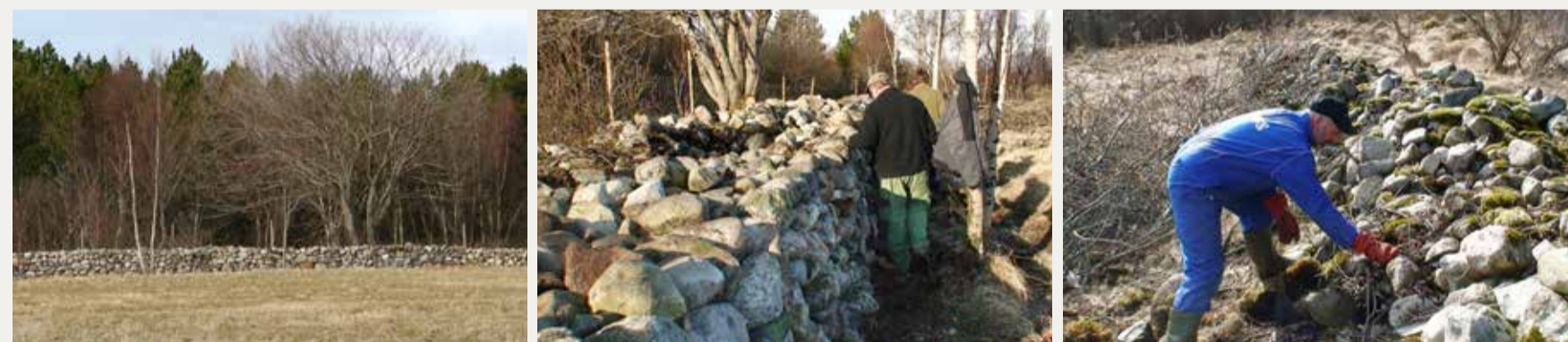
Våren 2009 ble det arrangert kurs i gråsteinsmuring på Leka. Steingarden her hadde forfalt siden 1970-tallet var delvis skjult av vegetasjon. Trær ble hogd og stein lagt på plass. Muren er av rullestein, og hver enkelt stein må legges riktig for at muren skal bli pen og stå støtt.