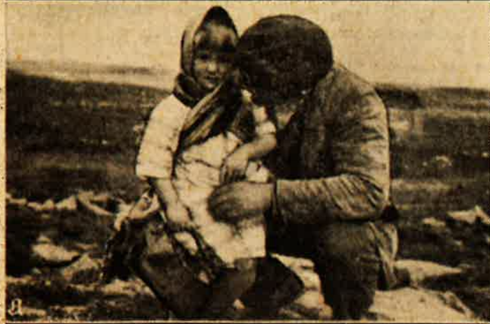
Øverst: Foreldrene og barnet. Nederst: Barnet og faren på det sted hvor ørnen tok barnet. (Se teksten side 2).